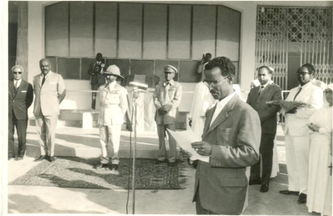
መትዋጃህ፡ ሃጻይ፡ ሃይሌ፡ ሥላሴ፡ ምስል፡ ገቢል፡ አቁርደት፡ እት፡ ሰነት፡ 1963። (ወግራአዝማች፡ ልጃም፡ እት፡ ልትሃጌ )።

ዲብ፡ ወርሕ፡ ምክሌል፡ ቀይም፡ ( ሕዳር ) ሰነት፡ 1962፡ እትዮጵያ፡ ኤርትራ፡ ከም፡ ሐምሸረት፡ (annexed ) ሐምሸሮት (annexation) ፡ ናይ፡ ኤርትራ፡ ሕክም፡ ኖስ፡ ትማሳሓ፡ ወኤርትራ፡ ሐቴ፡ ምነን " ጠቅላይ፡ ግዝአታት " ገአት። ወመክትብ፡ እንዳራሴ "ጠቅላይ፡ ግዛት " ትበሀላ። ጽንዓም፡ ስርዓት፡ (feudal system) ለፋጥረዮም፡ ውላድ፡ እትዮጵያ፡ ሰብ፡ አግጾት፡ እንደ፡ ገአው፡ ዲብ፡ መካትብ፡ እዳራት፡ ኤርትራ፡ ትሸበው።