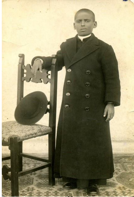
ሽምብረባይ፡ ግራአዝማች፡ ልጃም፡ ዲብ፡ ቫቲካን እት፡ ሰነት፡ 1935።

ግራአዝማች፡ ልጃም፡ ሐበን፡ ወሐገን፡ ጾዋ፡ ቤቱ፡ ወሞዳዩ፡ ዐላ። ሰበቡ፡ ሀዩኒ፡ ኦሮ፡ ምንላ፡ እብ፡ አጫብዕ፡ ለልትዐልቦ፡ ውላድ፡ ኤርትራ፡ ወአግዳ -አግዳ፡ ዲብ፡ ግዝአት፡ ጢላን፡ እግል፡ ውቅል፡ ደረጀት፡ ምህር፡ በሐር፡ ለታዕዳ፤ በዐል፡ ነግብ ፤ ስዑም፡ እት፡ ረሐት፡ እግሩ፤ ወኦሮ፡ ጽርራ፤ (star) ፡ መንሳዕ፡ ቤት ሽሑቃን፡ ቱ።