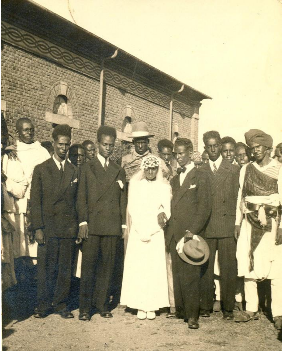
ህዳይ፡ ግራአዝማች፡ ልጃም፡ ወወይዘሮ፡ አሌን፡ ዲብ፡ ሕለት፡ ኪዳነ፡ ምሕረት፡ መዲነት፡ አስመራ ፡ እት፡ ሰነት 1940።

እት፡ ሰነት፡ 1941፡ ሕዳይ፡ ዐባይ፡ ብሪጣንያ፡ ሕዳይ፡ ኢጣልያ፡ እንደ፡ ፋላ፡ ኤርትራ፡ ዲብ፡ ሓንተ፡ ምልኩ፡ አታያ። ወእባ እባ፡ እዳረት፡ ዓስከርዬት፡ (Military Administration ) ዐባይ፡ ብሪጣንያ፡ ትመደደት። እንግሊዝ፡ እዳረት፡ ሸዓቢ፡ ማ፡ ብርገስ፡ እግል፡ ትምደድ፡ ደሎ፡ (preparation ) ፡ ዋይደት፡ ሰበት፡ ኢዐለት፡ መብዝሐ፡ ወቃይ፡ እዳራት፡ ወመሓብር፡ አባጣላ። ወክለን፡ ዳምክዮታት፡ ማ፡ ባንካት፡ ጢላን፡ ትዳባአያ። ከዲብ፡ አካነን፡ ናይ፡ እንግሊዝ በርከለይስ፡ በንክ፡ ለትትበሀል፡ አደንገበት። ወዲብ፡ ዳምክያት፡ ጢላን፡ ሻቁ፡ ለዐለው፡ ውላድ፡ ኤርትራ፡ ወጥልያን፡ ምን፡ ሸቅል፡ ፈግረው፡ ከዲብ፡ አካኖም፡ ውላድ፡ ህንዲ፡ ወሱዳን፡ አደንገበው። ወባጠራ፡ ማ፡ ቅርሽ፡ ጢላን፡ ሊረ፡ (Lire) ልቡሎ፡ ለዐለው፡ እብ፡ ሸልን፡ ናይ፡ ምፍጋር፡ ጸሓይ ፡ አፍሪቃ፡ ትቃያራ።