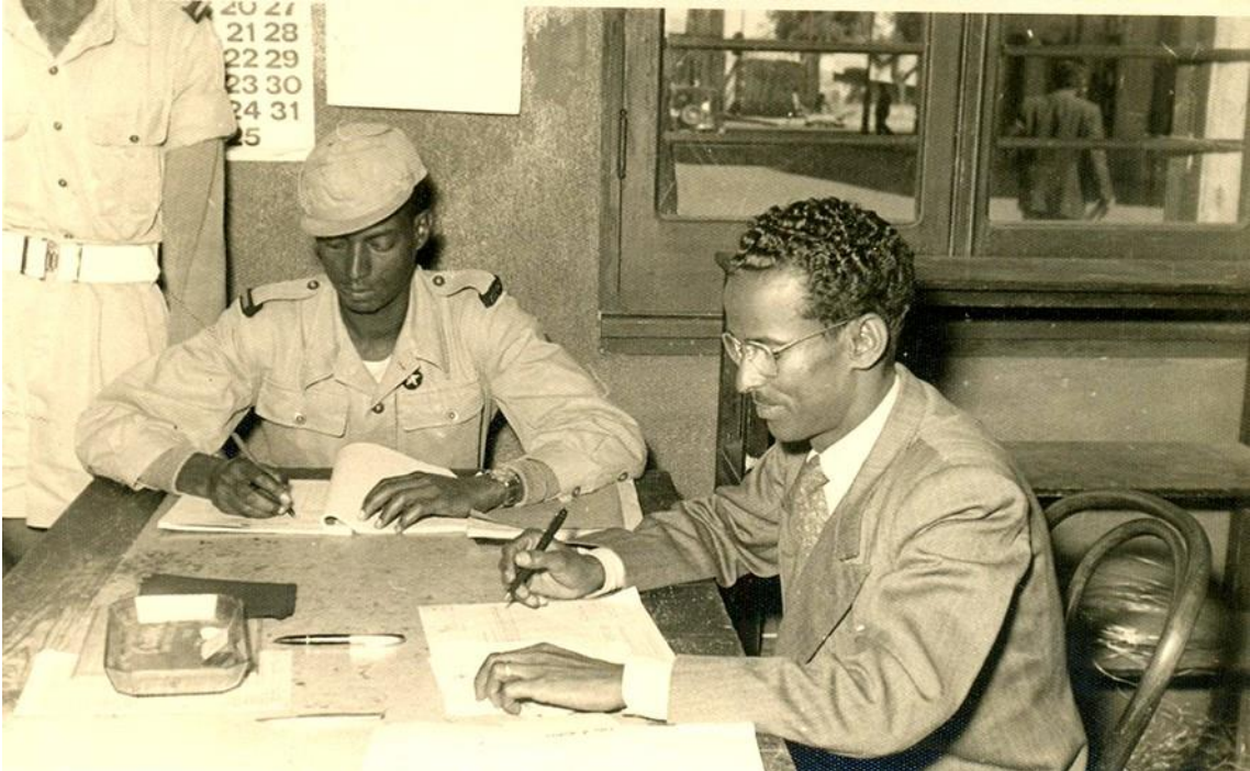
ግራክዝማች፡ ልጃም፡ ዲብላ፡ እት፡ አስመራ፡ ለዐላ፡ መከተብ፡ ረፈግ ፡ ( ቀረጽ ) ፡ ( ግምሩክ ) እት፡ 1950ታት፡፡

ዲብ፡ ወርሕ፡ ገብረኤል (ተሐሳስ ) ፡ ሰነት፡ 1951፡ ምስል፡ ዕያሉ፡ ዲብ፡ ዐዱ፡ ኤርትራ፡ አስመራ፡ ክም፡ አቅበላ፡ እትላ፡ እት፡ አስመራ፡ ለዐላ፡ መከተብ፡ ጥልበት፡ ማ፡ መከተብ፡ ረፈግ፡ እባ፡ እባ፡ ሸቅል፡ አንበታ፡፡ ወሐቆ፡ ፈደረሸን፡ ዲብ፡ ወርሕ፡ የሐንስ ( መስከረም ) 1952፡ ለመከተብ፡ ዲብ፡ ሐንተ፡ ስልጣን፡ እትዮጵያ፡ አታ፡፡ ግራክዝማች፡ ላቱ፡ እታ፡ ሸቅሉ፡ ሐጣ፡፡ ወዲብ፡ ሰነት፡ 1954፡ ዲብ፡ መርሳ፡ ባጽዕ፡ ናይ፡ መከተብ፡ ረፈግ፡ ማ፡ ቀረጽ፡ በዐል፡ ገጽ፡ እንደ፡ ገአ፡ ሰበት፡ ትሻያማ፡ መንዘል፡ ወሸቅል፡ ቃያራ፡፡ ወሐቆሁማ፡ እት፡ አስመራ፡ ትቃያራ፡ ከአታ፡ ዲብ፡ መከረዩ፡ ጥያራት፡ አስመራ፡ ለዐላ፡ መከተብ፡ ረፈግ፡ ውቁል፡ በዐል፡ ገጽ፡ ገአ፡፡ ወእት፡ ረአሰላ፡ ዐላ፡ እሉ፡ ዐቢ፡ መዙ፡ ምን፡ ሰነት፡ 1955፡ አስከ፡ ሰነት 1956፡ ናይ፡ ሕዳገት፡ ወክድ፡ (part time ) ፡ መምህር፡ እንደ፡ ገአ፡ ዲብ፡ ቤት፡ ምህር፡ አዋልድ፡ ኮምቦኒ፡ አምሃራ፡፡